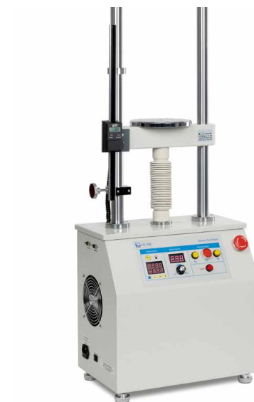
Banco di prova motorizzato incl. misuratore di lunghezza digitale LB