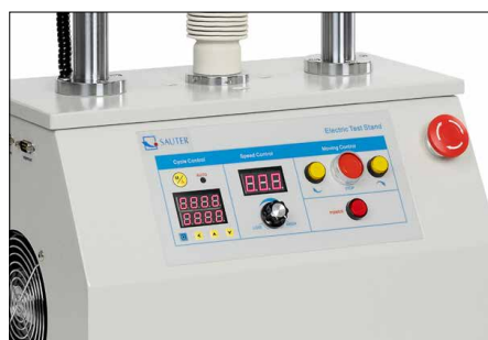
Pannello di controllo Premium - Indicatore digitale di velocità - Funzione digitale di ripetizione